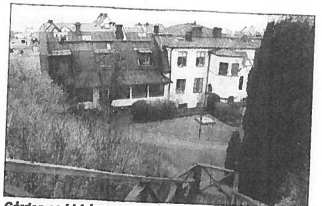
Gården sedd från trappan upp till Kilnten där föreningen har sitt lusthus.